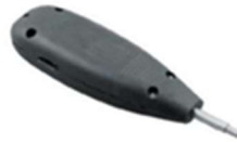
Impactadora QDF Cuello Corto o Largo