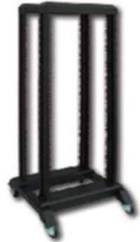
Bastidor Laboratorio 19"