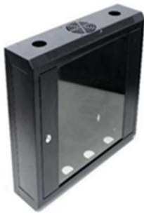
Rack Mural Serie RM19"