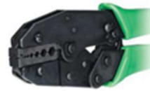
Crimpadora Coaxial Flex2-3-3,9-5