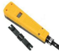
Impactadora Sistema 110 o Tipo Krone