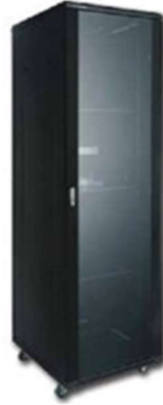
Rack Serie RS 19"